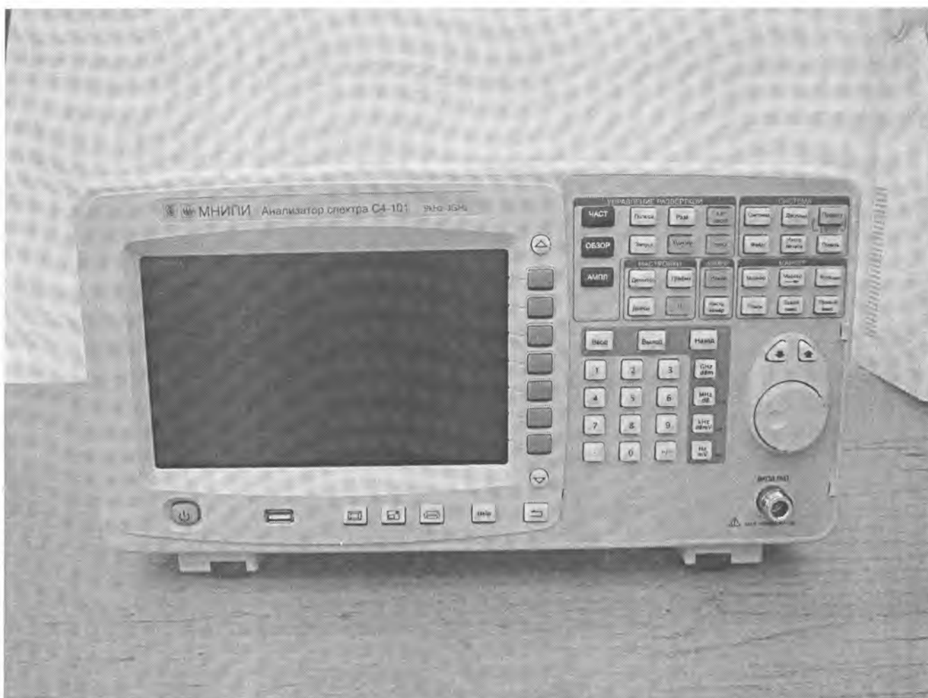
Рисунок 1 – Внешний вид анализаторов

Место нанесения знака поверки (клейма-наклейки) показано в приложении А, рисунок А1, места нанесения оттиска знака поверки и оттиска клейма ОТК (сзади передних ножек анализатора) показаны в приложении А, рисунок А2.