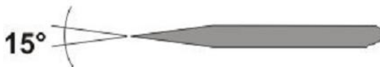
Рис.2 Форма заточки вольфрамового электрода

Электрод должен быть соответствующим образом заточен: