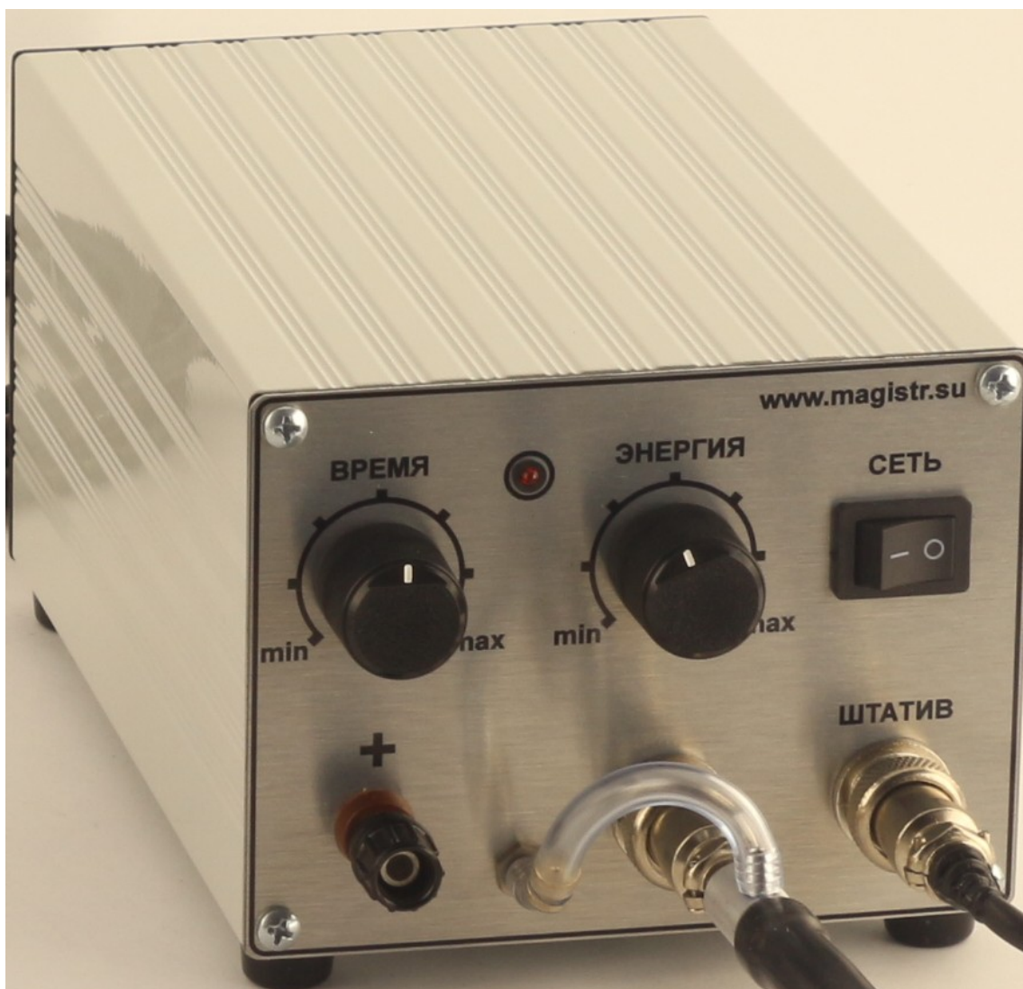
Фото 2. Общий вид блока управления

берет инструмент и прижимает рабочий конец электрода к месту сварки.