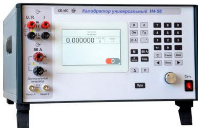
Рисунок 1 - Общий вид калибратора универсального H4-56

Место пломбировки от несанкционированного доступа к режиму цифровой калибровки (юстировки) калибратора H4-56