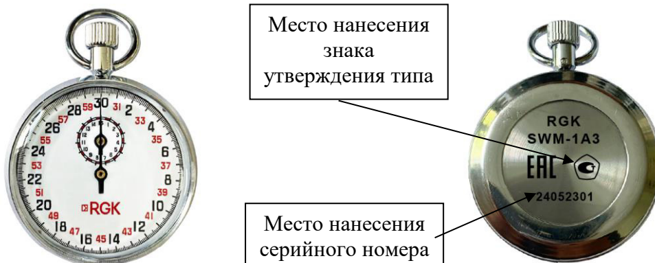
а) модификация SWM-1A3

Корпуса секундомеров изготавливают из стали, окрашиваемой в цвета, которые определяет изготовитель.