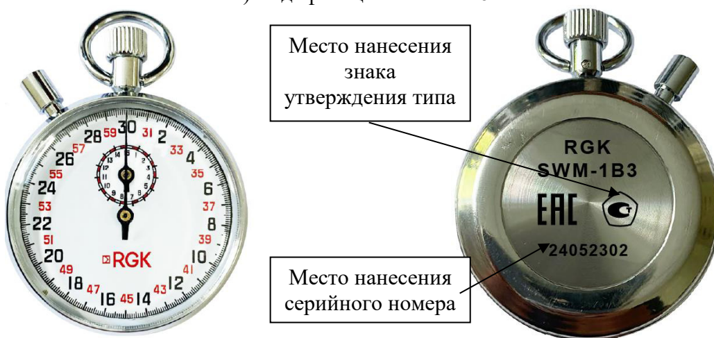
в) модификация SWM-1B3