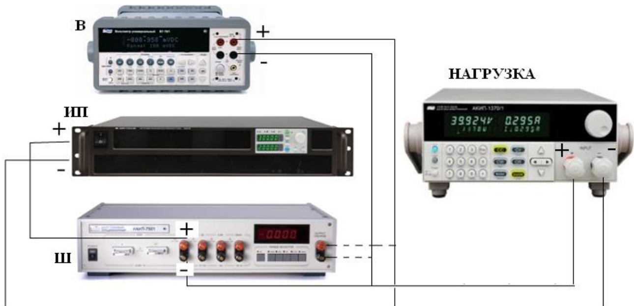
Рисунок 3 - Схема подключения приборов при определении абсолютной погрешности установки и измерений мощности при работе в режиме стабилизации мощности.

2 В зависимости от модели электронной нагрузки выбирают R_{ном} шунта токового таким образом, чтобы протекающий ток через нагрузку не превышал максимального тока I_{макс} на R_{ном} шунта.